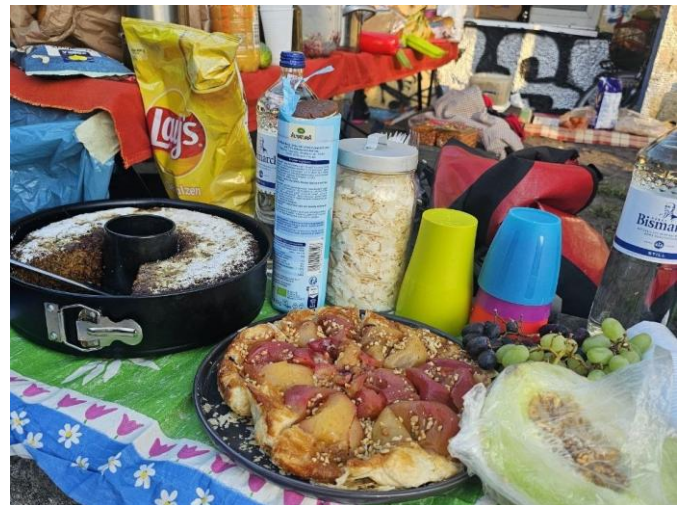
„Ein offenes Buffet“

Viele der Anwesenden kennen sich. Einige kommen seit Jahren. Und doch wirkt die Gruppe nie geschlossen. Neue Gesichter fallen auf – aber nicht im Sinne von Abgrenzung. Eher als stille Einladung. Ein Blick, ein Lächeln, ein wenig Platz auf der Tanzfläche. Mehr braucht es nicht, um dazugehören.