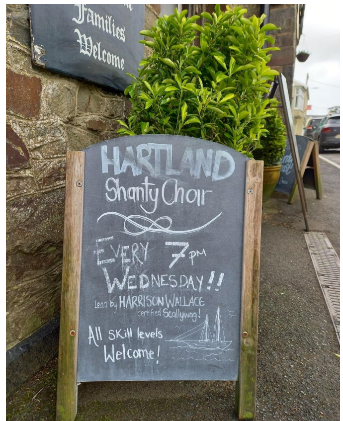
Ein Aufsteller vor dem Pub wirbt für den Shanty-Chor mit Harrison Wallace.