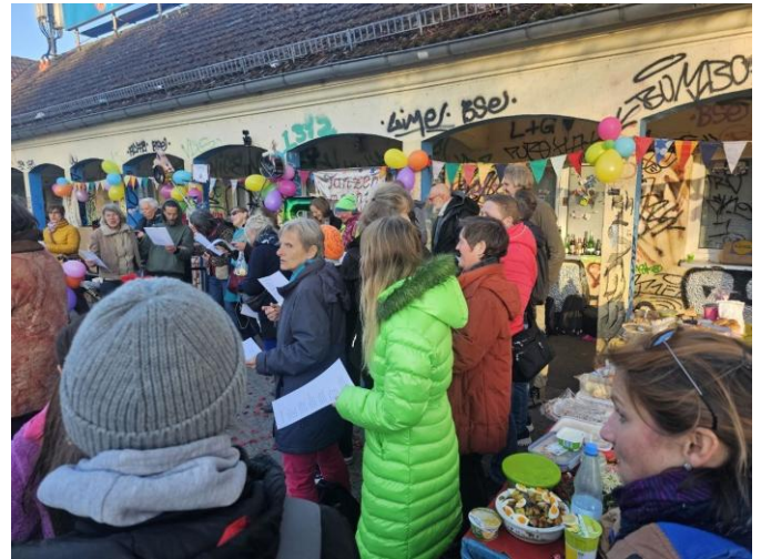
Zum 5-jährigen Jubiläum

Ich, der Autor dieses Artikels, bin nach längerer Abwesenheit zum fünften Jahrestag von „Tanzen macht glücklich“ zurückgekehrt.