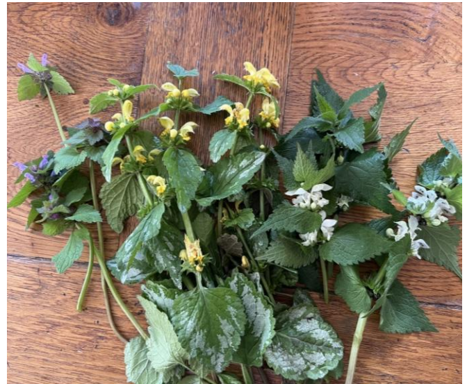
Drei Gesichter einer Pflanze: Links und rechts die purpurne und die weiße Taubnessel. In der Mitte die Goldnessel mit ihren silbrig glänzenden Blättern.

Taubnesseln reihen sich damit ein in eine ganze Riege bekannter Küchenkräuter wie Thymian, Salbei, Basilikum, Oregano, Melisse oder Minze.