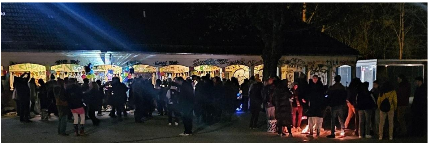
Tanzen bei Nacht