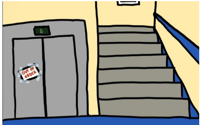
Illustration: Frida Aue

Jedenfalls wurden die meisten Erfindungen aus der Notwendigkeit geboren. „Not macht erfinderisch!“. Eine Künstlerin – sie bezeichnet sich selbst als „Trash-Designerin“ – aus Kiel zum Beispiel hat ihr „Herz für Plastikverpackungen“ entdeckt und gestaltet damit nun Bilder und stellt diese auch aus. Angefangen hatte es bei ihr nach eigenen Angaben damit, dass sie selbst etwas brauchte. Wovon sie mehr als genug hatte, waren Plastikverpackungen.