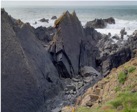
Was für ein schöner Tag: erst an der wilden Nordküste laufen, dann einen großartigen Mitsingevent im Anchor Inn in Energie erleben.