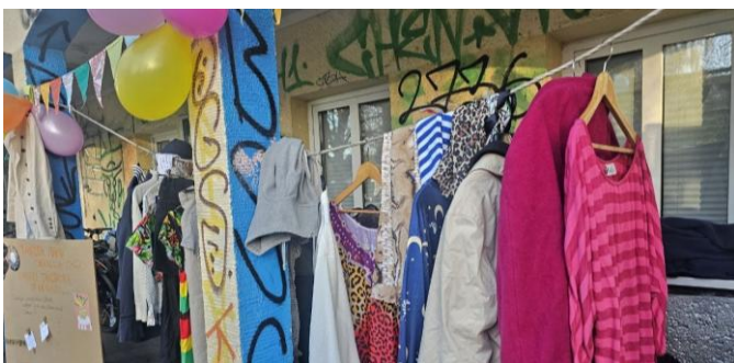
„Daneben hängt eine lange Wäscheleine.“

Auf einer kleinen Mauer sitzen Menschen, unterhalten sich, teilen Essen. Ein offenes Buffet entsteht ganz nebenbei: Brot, Aufstriche, Selbstgemachtes, Snacks, Getränke – alles wird einfach dazugestellt.