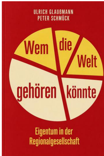
Cover: Massel Verlag · 2026, 25 €